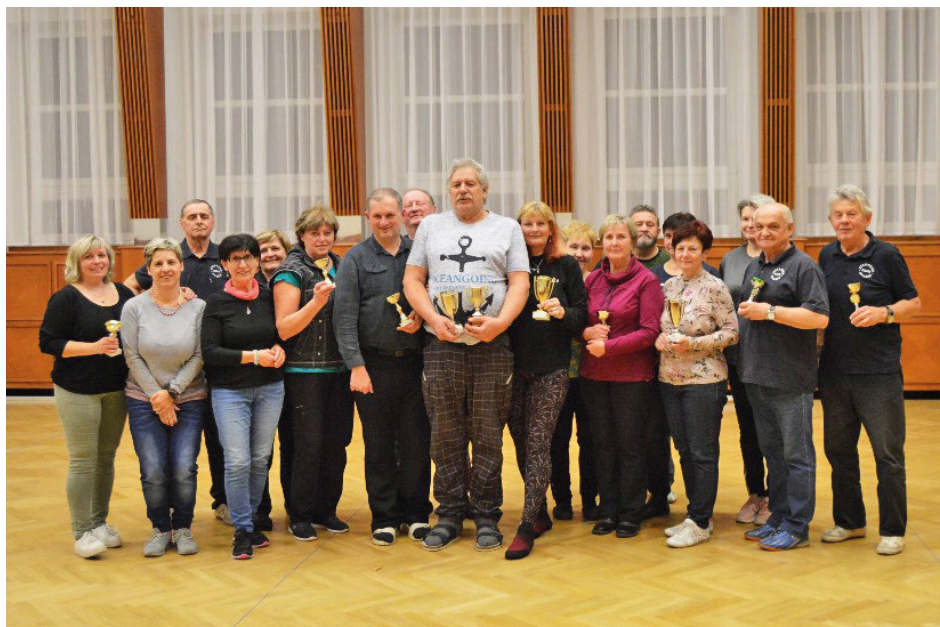
Účastníci 24. ročníku Vánočního turnaje

Další naší pravidelnou akcí je Zimní přebor klubu , kterou hráváme na začátku roku.